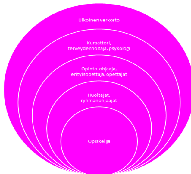
Kuva 1. Hyrian opinto-ohjauksen malli van Esbroeck'n ja Watts'n (1998) holistisen ohjauksen mallista mukailtu.

Hyriassa toteutetaan holistista ohjausmallia. Holistisen ohjausnäkökulman mukaan ohjaus kuuluu kaikille. Ohjauksen asiantuntijuus on porrastettu, koska opiskelijoiden ohjaustarpeet ovat erilaisia. Mitä vaativampaa ohjausta opiskelija tarvitsee, sitä pidemmälle erikoistunutta ohjaushenkilöstöä käytetään. Tämä edellyttää myös tiivistä moniammatillista yhteistyötä. Ohjausmallin tavoitteena ovat kasvun ja kehityksen tukeminen, opintojen ohjaus sekä ammatinvalinnan tai urakehityksen tukeminen. Mallin keskiössä on opiskelija.